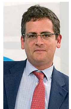
Antonio Basagoiti.

El próximo día 4 de noviembre, Antonio Basagoiti intervendrá como invitado en los Desayunos de NEGOCIO. No será el único personaje de la actualidad política en desfilar por este foro, ya que posteriormente acudirán el ex ministro de Trabajo Jesús Caldera, actual presidente de la Fundación Ideas, y el consejero de Economía de la Comunidad de Madrid, Antonio Beteta. ♦