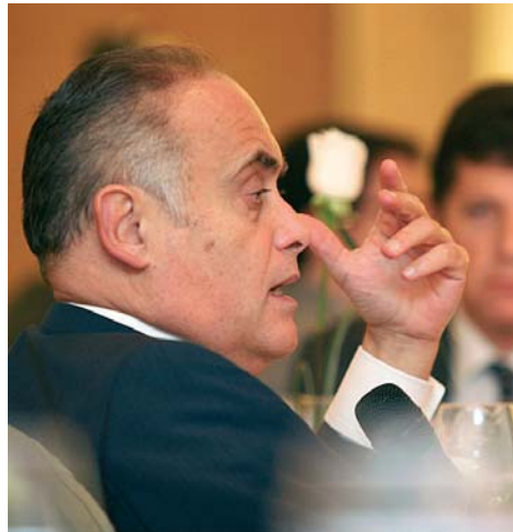
El debate se animó con las alusiones al sector financiero. D.S.G.

No obstante, Berenguer aclaró: "Me da la impresión de que a Bruselas le gustaría que fueran las propias entidades financieras españolas las que presentaran las correspondientes denuncias antes casos como éstos". Aunque dejó bien claro que "esto es sólo una impresión mía, no tengo más información al respecto".